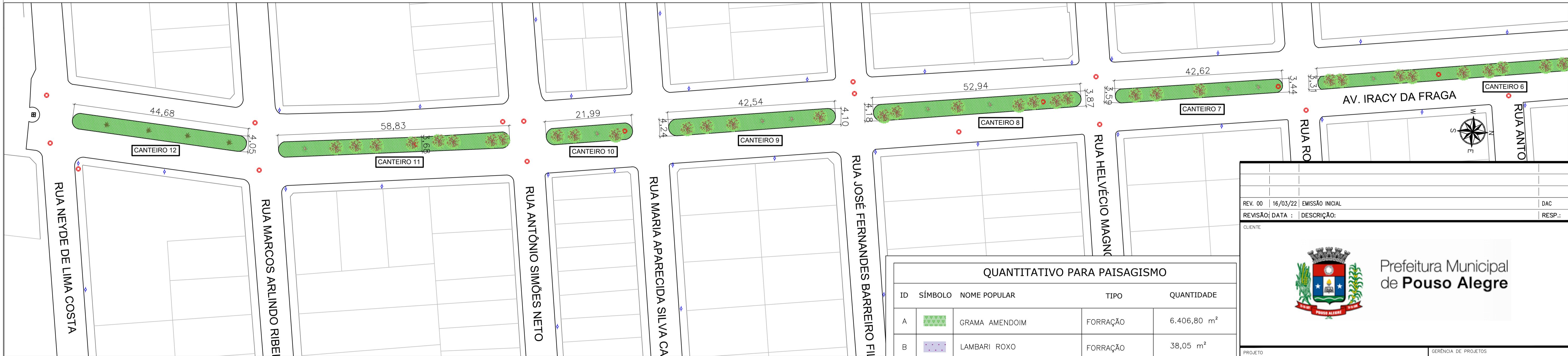
PLANTA BAIXA - TRECHO 3 ESCALA 1:500